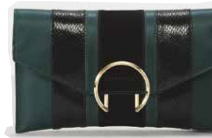
Tasche: Liebeskind Berlin

Wer sagt denn, dass sich das unbekümmerte Spiel mit Farben und Formen zwischen Outfit und Accessoires entscheiden muss? Nicht «Entweder – oder» lautet die Devise, sondern mehr ist mehr und so macht sich die grenzenlose Lust am Muster von Kopf bis Fuß breit und zieht sich uneingeschränkt durch alle Bereiche der sommerlichen Garderobe.