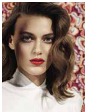
Unser Cover: Hair Marc Lopez Make-up Steffen Zoll Styling Anna Schiffel Model Ellen De Weer