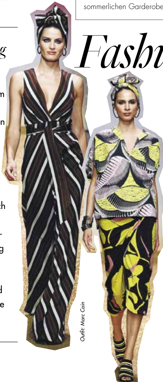
Outfit: Marc Cain

Farbe heißt das große Trendthema der Saison, das zum einen grafisch streng, zum anderen überbordend floral interpretiert wird. Berührungängste gibt es dabei nicht, denn Streifen und Blüten vertragen sich nicht nur hervorragend, sondern bringen sich gegenseitig auf sehr reizvolle Weise zur Geltung. Machen Sie mit und erleben Sie die neue Muster-Lust!