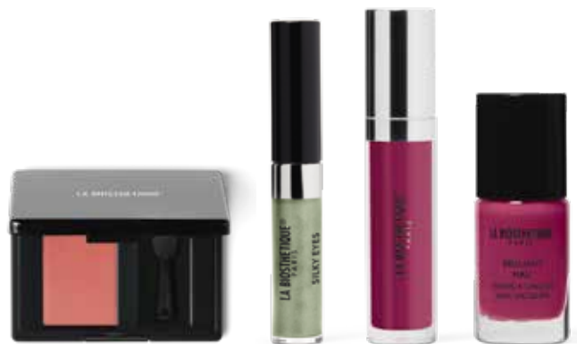
Magic Shadow Mono 44 Flamingo Silky Eyes Fern Cream Gloss Dragonfruit Brilliant Nail Pink Magenta

Schon die Farbnamen entführen in tropische Gefilde. Magic Shadow Mono 44 Flamingo betont das bewegliche Lid bis zum inneren Augenwinkel, Silky Eyes Fern das Unterlid. Die Lippen glänzen verführerisch mit Cream Gloss Dragonfruit . Abgerundet wird der Look durch Pencil for Eyes Khol Silk auf der Wasserlinie, der Mascara Perfect Volume Black , und mit Pink Magenta lackierten Nägeln. Das Haar ist am Hinterkopf zusammengebunden und im vorderen Bereich mit einem großen Lockeneisen geformt.