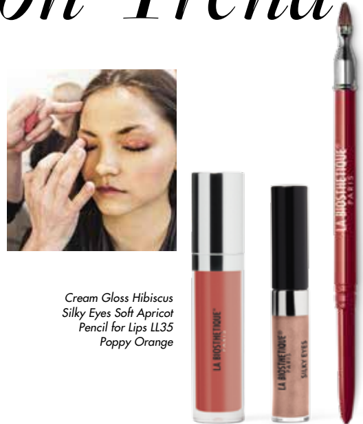
Cream Gloss Hibiscus Silky Eyes Soft Apricot Pencil for Lips LL35 Poppy Orange

Von Apricot bis Orange – fruchtige Rotnuancen auf Lippen, Wangen und Augenlidern wirken frühlingsfrisch und passen zu jedem Outfit.