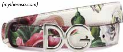
Gürtel: Gucci (mytheresa.com)