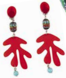
Accessoires: Marc Cain