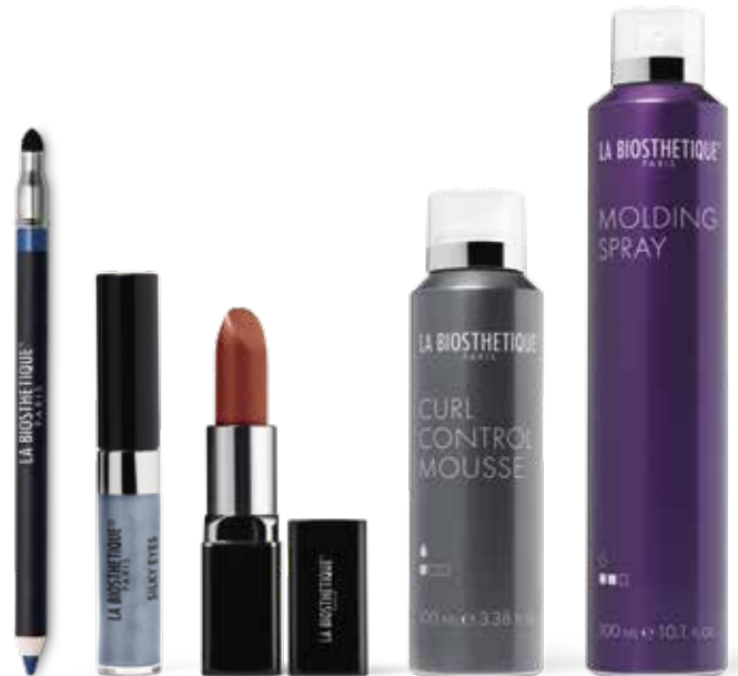
Eye Performer Blue Lagoon Silky Eyes Steel Blue Sensual Lipstick B 234 Sunset Curl Control Mousse Molding Spray

Von wegen kühl! Beinahe hypnotisch wirkt der Blick aus blau umrandeten Augen. Der Lidstrich mit Eye Performer Blue Lagoon intensiviert das helle Blau des Silky Eyes Steel Blue . Earth Glow Gel zaubert einen subtilen Glow ins Gesicht. Abgerundet wird der Look mit dem orange-roten Sensual Lipstick B234 Sunset . Für die eng am Kopf anliegenden, von den 1920er-Jahren inspirierten Wellen etwas Curl Control Mousse ins leicht feuchte Haar geben, die Haare mit dem Kamm in Wellenform legen, mit Haarklammern fixieren und mit dem Diffusor trocknen. Molding Spray gibt dem fertigen Look Halt.