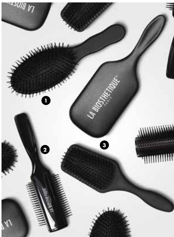
1 Styling Brush 2 CeramicHair Brush C-2000 3 Denman D83 Large & Denman D84 Small

Die extrabreite Arbeitsfläche der aus besten Materialien sorgsam verarbeiteten Bürste ist mit 9 oder 13 Reihen noppenbesetzter Nylonborsten bestückt, mit denen sich selbst langes Haar schnell, schonend und ohne Ziepen glatt kämmen und föhnen lässt.