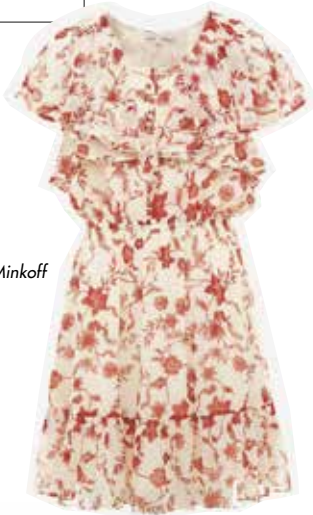
Kleid: Rebecca Minkoff (zalando.de)