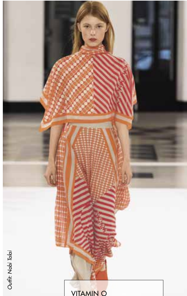
Outfit: Nobli Talai

Streublümchen-Muster sind als Inbegriff romantischer Weiblichkeit ein ewig junger Dauerbrenner. Diese Saison tummeln sie sich nicht nur auf verspielten Rüschenkleidern, sondern zieren auch Ledernes wie Gürtel, Schuhe und Taschen. Die wirken durch das florale Update plötzlich leicht, beschwingt und wie vom Frühling selbst designt.