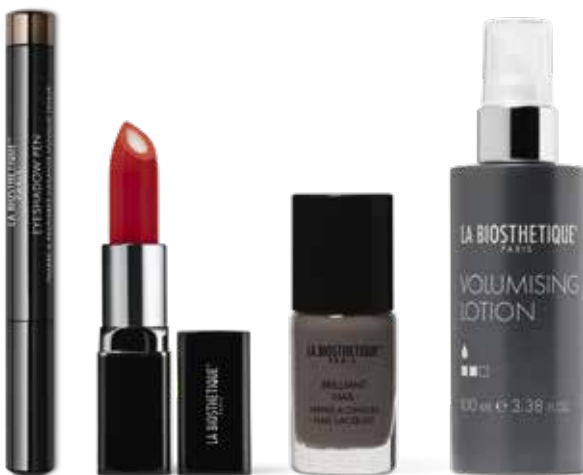
Eyeshadow Pen Macadamia Color Care Hot Mandarin Brilliant Nail Pebble Stone Volumising Lotion

Schöne, gepflegte Lippen stehen im Blickpunkt des zeitlosen Looks. Intensive Pflege und verführerische Farbe schenkt der Color Care Lipstick Hot Mandarin . Die Augen werden durch Umrahmen mit dem Eyeshadow Pen Macadamia subtil betont, ohne dem Mund die Show zu stehlen. Das Haar erhält luxuriöse Fülle, indem es, noch leicht feucht, mit Volumising Lotion besprüht, mithilfe der Frisierbürste trocken geföhnt und in großzügigen Partien mit dem Lockenstab geformt wird.